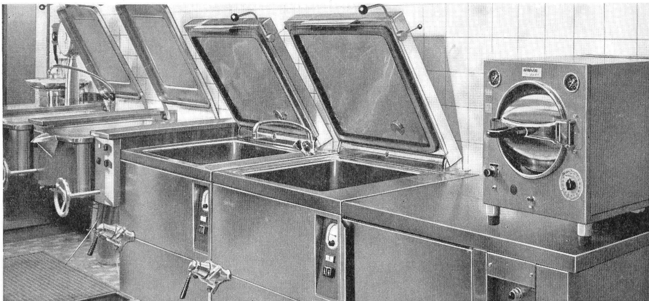
Teilansicht Kantine Geigy – Burckhardt Architekten SIA

SALVIS ÜBERNIMMT als Generalunternehmer die Einrichtung von kompletten Grossküchenanlagen. Für Bauherr und Architekt bedeutet dies eine preisgünstige, rationelle Lösung.