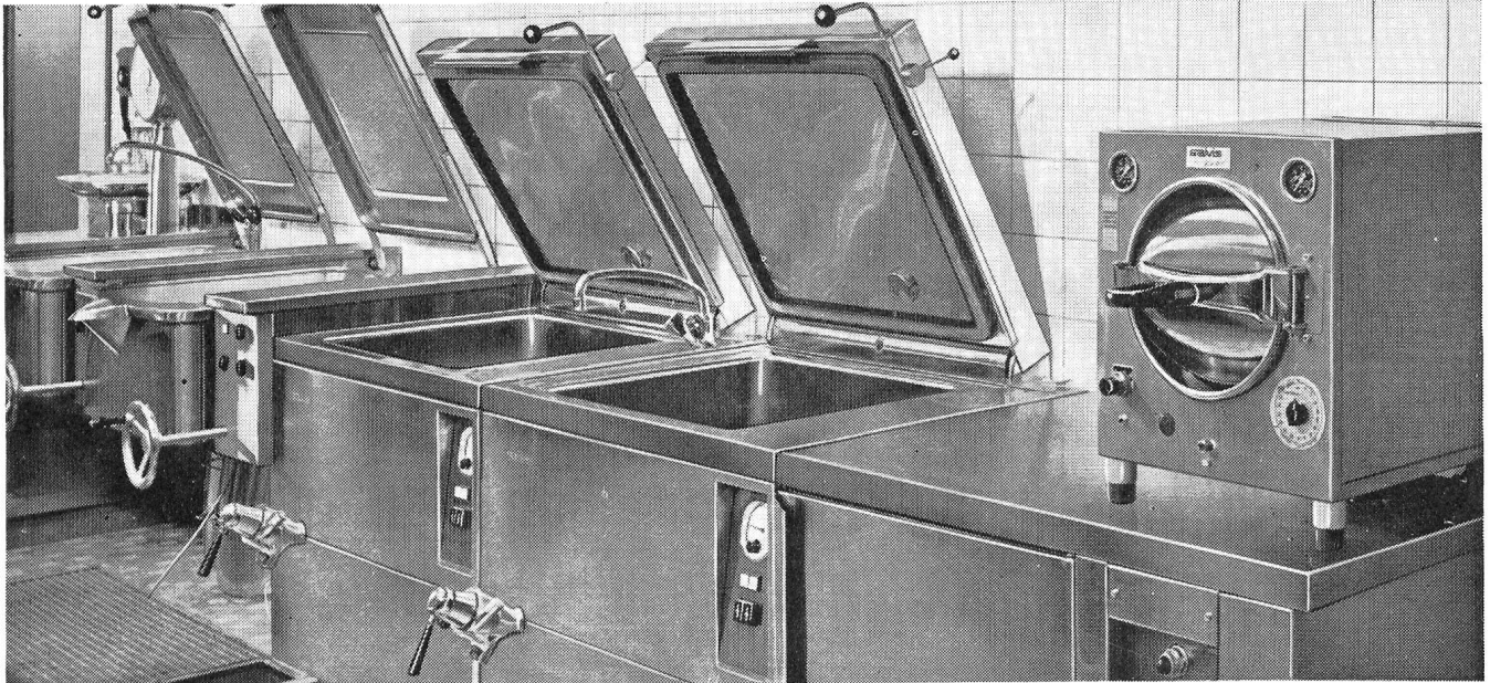
Teilsicht Kantine Geigy - Burckhardt Architekten SIA

SALVIS ÜBERNIMMT als Generalunternehmer die Einrichtung von kompletten Grossküchenanlagen. Für Bauherr und Architekt bedeutet dies eine preisgünstige, rationelle Lösung.