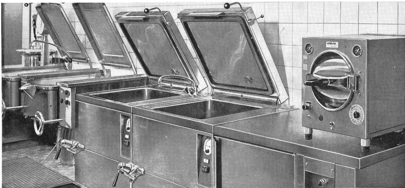
Teilansicht Kantine Geigy – Burckhardt Architekten SIA

SALVIS ÜBERNIMMT als Generalunternehmer die Einrichtung von kompletten Grossküchenanlagen. Für Bauherr und Architekt bedeutet dies eine preisgünstige, rationelle Lösung.