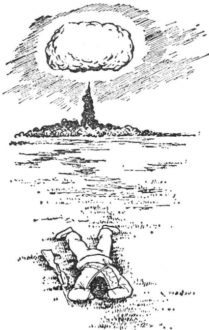
图四 无地形、地物可利用时，应就地背向爆炸中心卧倒，并将手掩盖好

wird der Zivilschutz vor allem von den Kommunisten bekämpft, denen sich unbelehrbare Pazifisten und Querulanten zugesellen.