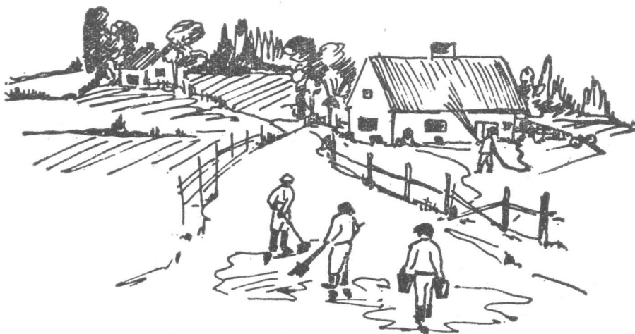
Rakennusten katot puhdistetaan saasteesta vesisuihkulla. Kulkutiet lakaisemalla kosteana, runsaalla vesisuihkulla tai kuorimalla pintakerros.

ovat suojapuku, -naamari, -jalkineet ja -käsineet välttämättömät.