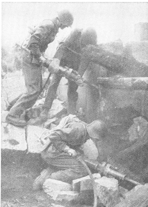
Luftschutztruppen im Einsatz.