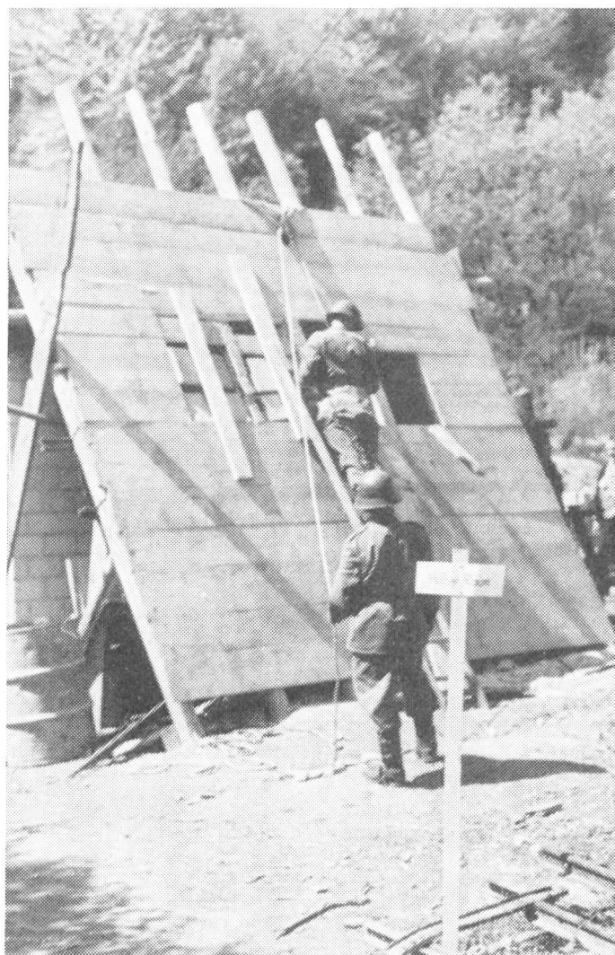
Diese Station nannte sich «Halber Raum», eine vorkommende Situation beim Einsturz von Häusern, der für die Bergung von Verletzten wieder ein anderes Vorgehen verlangt.