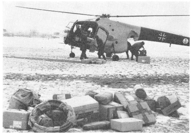
15 Marineflieger der Bundeswehr bringen Post auf eine vom Eis eingeschlossene Insel.

Sparten des Katastrophen- und des Zivilschutzes viel mehr als bisher Aufklärung darüber erhalten, wann und wie man Luftfahrzeuge einsetzen kann und was diese zu leisten vermögen. Nur durch enge Zusammenarbeit zwischen den herkömmlichen Rettungsdiensten auf der Erde und der fliegenden Hilfe kann ein bestmögliches Ergebnis für alle Beteiligten, nicht zuletzt für die hilfsbedürftigen Opfer von Katastrophen, erzielt werden.