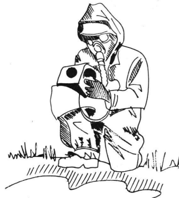
ABC-Spezialist mit Strahlenmessgerät im Einsatz