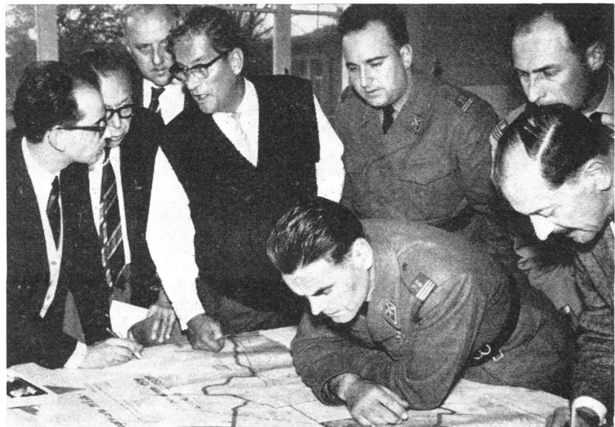
Das Zusammenwirken der zivilen und militärischen Mittel erfordert gemeinsame Gedankenarbeit und Diskussionen.