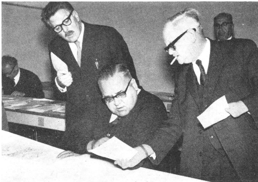
Ein weit über 1000 Einzelmeldungen umfassendes Drehbuch schildert Ereignisse und Reaktionen. Die Schiedsrichter überwachen den gewollten zeitlichen Ablauf des Spiels.

Ein anderes ebenso schlüssiges Mittel zur Uebung und Prüfung der Zusammenarbeit der Kader ist die «Taktische Uebung», die in letzter Zeit verschiedenenorts an die Stelle der kombinierten Zivilschutzübung trat und auch im Jahre 1964 diese durchgehend ersetzen wird. Auch hier wird eine Katastrophenlage angenommen, die jeden Chef und jeden Kommandanten dazu zwingt, die Lage in seinem Bereich zu beurteilen, Entschlüsse zu fassen und die entsprechenden Befehle zu erlassen. Es spielt der taktische Apparat auf allen Stufen; lediglich das technische