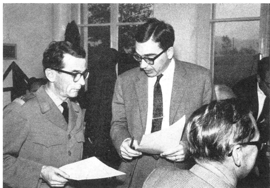
Die Schwere der Verantwortung zeigt sich in den Gesichtern des Chefs des Sanitätsdienstes der örtlichen Schutzorganisation (rechts) und des Truppenarztes (links) bei der Diskussion der sanitätsdienstlichen Massnahmen.