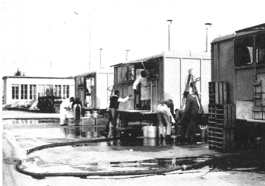
Für das leibliche Wohl der 400 Teilnehmer sorgt in ausgezeichnete Weise der mit modernen Küchenanhängern ausgerüstete Verpflegungsdienst der örtlichen Schutzorganisation Zürich.

Hier ging es darum, dass in den betroffenen Gebieten alle Mittel sofort differenziert eingesetzt und in den verschonten Sektoren die noch freien Mittel zur Verwendung in den grossen Schadenzentren zur Verfügung gestellt wurden. Durch Befehle und Meldungen wurde die Flut von Aufgaben kanalisiert, das Wichtige von Unwichtigem getrennt, für die Betreuung der Verwundeten und Obdachlosen gesorgt, immer mit dem Hauptziel: die Menschen zu retten — das Ueberleben der Stadt zu gewährleisten. Dabei mag sich mancher Verantwortliche gefragt haben: Habe ich die Mittel, um eine solche Lage zu meistern, wie sie in meinem Bereich entstehen kann? Habe ich genug Leute? Bekomme ich genug Wasser, um trotz Feuer durchzukommen? Genügen meine Transportmittel?