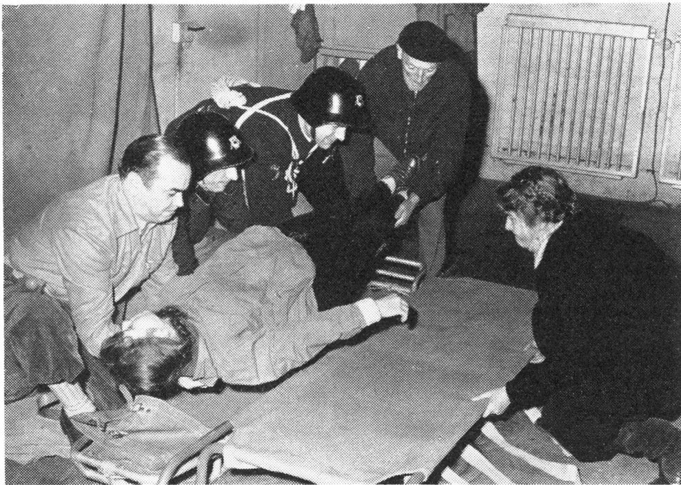
Die Arbeit in der Sanitätshilfsstelle Schaffhausen anlässlich einer Nachtübung

dies oft in unserem Kanton der Fall ist — zu hoch sind. Die von der Amtsstelle jährlich durchgeführten Rapporte mit den Kantonsinstruktoren, den Orts- und Dienstchefs dienen zur Besprechung der Arbeitsprogramme und Ausbildungskurse aller Dienstzweige sowie der Weiterausbildung des gesamten Kadeters.