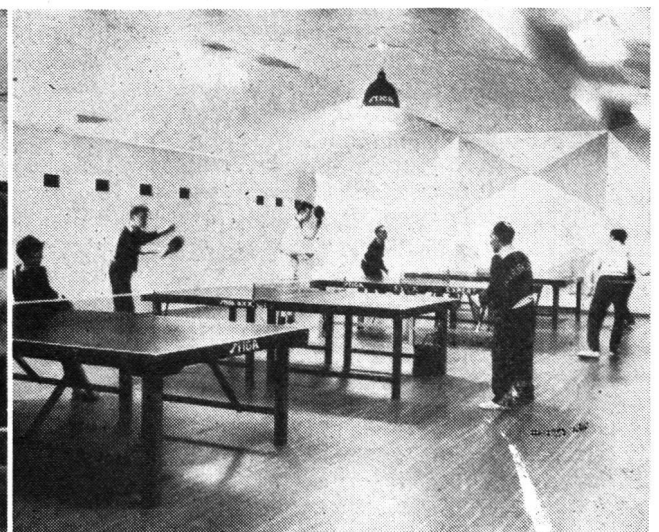
Hier der Raum für Tischtennis in den vielseitigen Schutzraumanlagen von Karlskrona, im Frieden ein Freizeitzentrum für die Jugend.