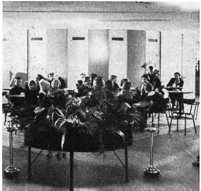
Auch ein Restaurant mit Barbetrieb und Selbstbedienung fehlt nicht.