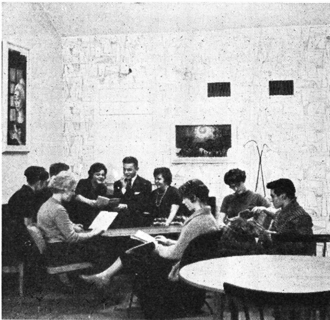
Selbst 20 m im Fels lässt sich gut leben, wie dieses Bild aus einem Freizeitraum in Karlskrona zeigt, wo modernste Frischluftanlagen und eine gediegene Ausstattung keineswegs an einen Bunker erinnern.