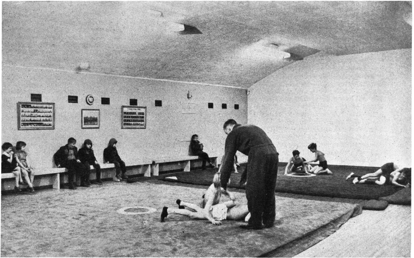
Dieses Bild zeigt die Ausnutzung einer der Räume der Schutzraumanlagen in Karlskrona als Sportlokal für die Jugend, wo sich die Junioren im Ringen und Schwingen üben.