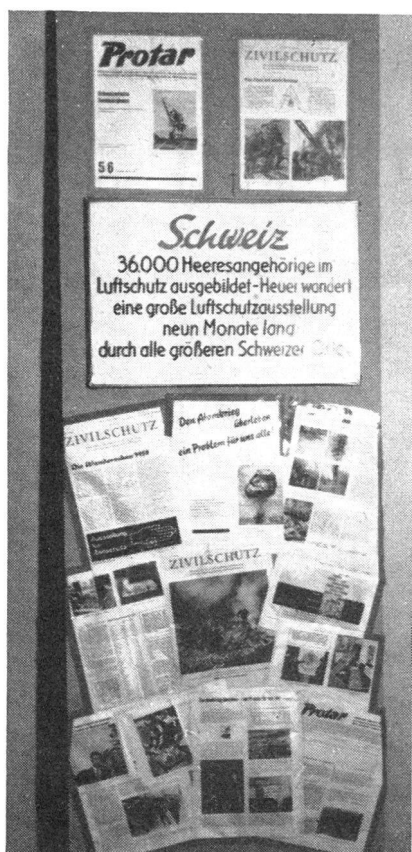
Schweizer Zivilschutz an der Wiener Herbstmesse

Ist der Luftschutz zu schwach, kann schon die Drohung eines Luftangriffs zur Kapitulation zwingen. General Svedlund