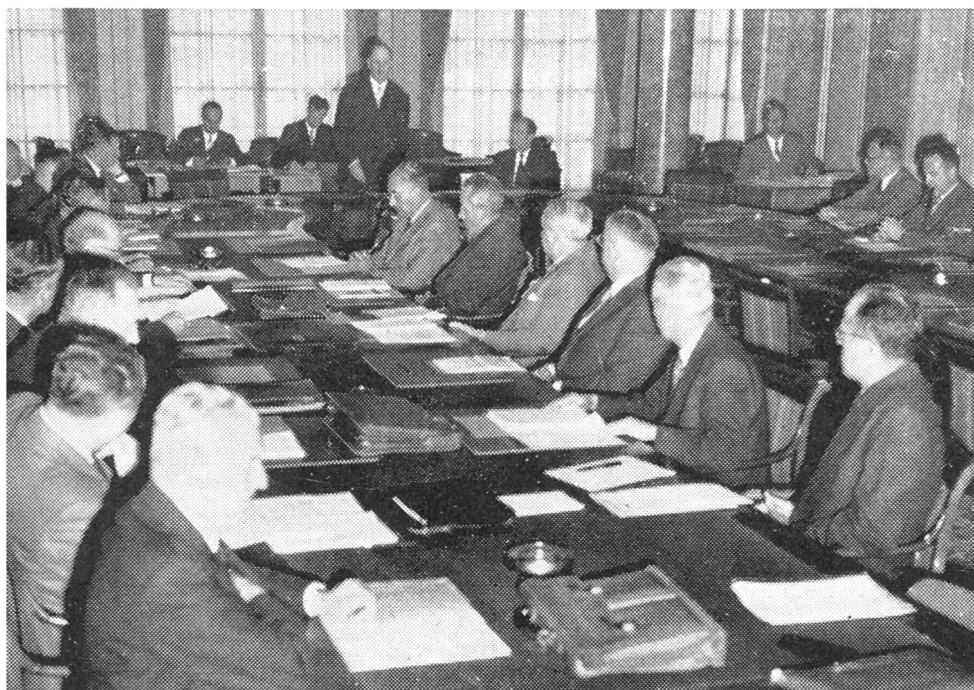
In Bern ist der Landesverteidigungsrat zu seiner ersten Arbeitssitzung zusammengetreten. Unsere Aufnahme zeigt den neuen Rat während der Orientierung durch Bundespräsident Chaudet über den Stand der Arbeiten im Zusammenhang mit der Armee-Reorganisation