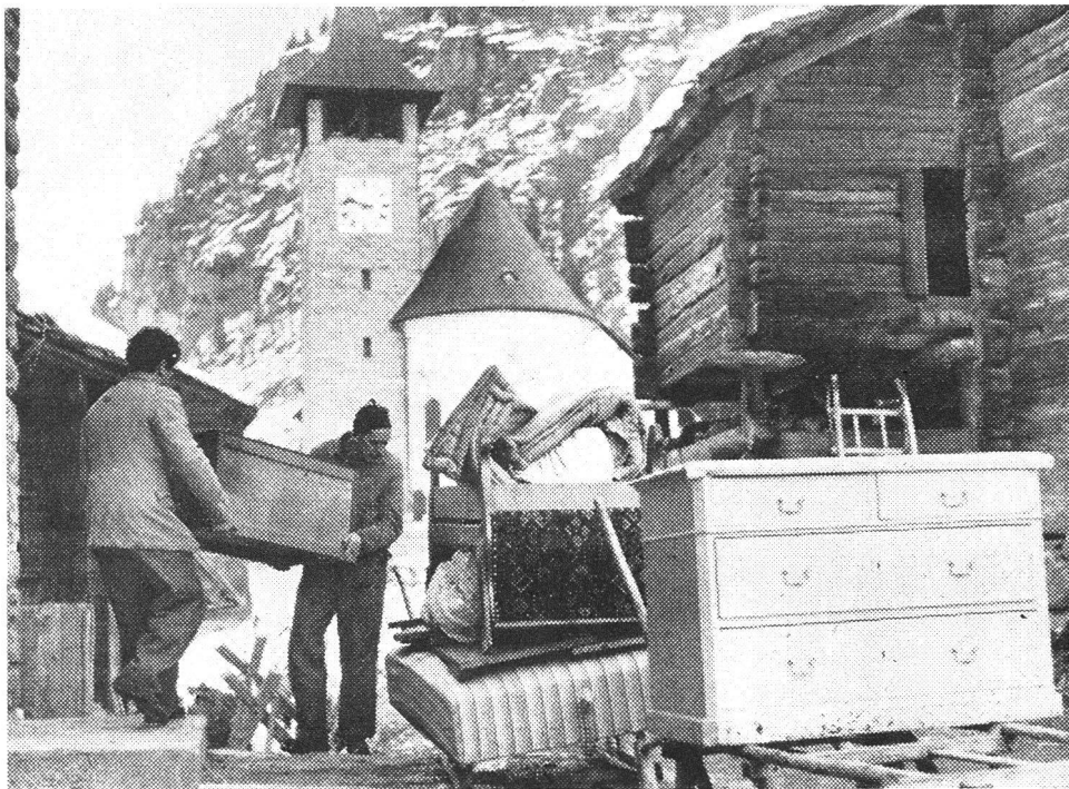
Der am 24. Mai 1959 zum Entscheid stehende neue Verfassungsartikel für den Zivilschutz bestimmt in einem besonderen Absatz: «Das Gesetz ordnet den Einsatz von Organisationen des Zivilschutzes zur Nothilfe.» Die Annahme des Verfassungsartikels bedeutet also auch eine rechtliche Fundierung der Zivilschutzhilfe im Frieden.