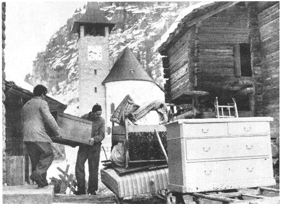
Der am 24. Mai 1959 zum Entscheid stehende neue Verfassungsartikel für den Zivilschutz bestimmt in einem besonderen Absatz: «Das Gesetz ordnet den Einsatz von Organisationen des Zivilschutzes zur Nothilfe.» Die Annahme des Verfassungsartikels bedeutet also auch eine rechtliche Fundierung der Zivilschutzhilfe im Frieden.