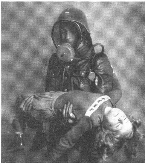
Der Preßluftatmer für den Gasschutz im Rettungsdienst