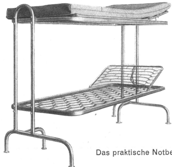
Das praktische Notbett