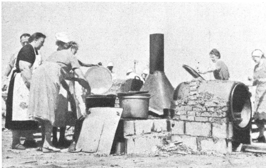
Auch die Notverpflegung, wie sie hier amerikanische Frauen üben, gehört zur Obdachlosenhilfe (vgl. den Artikel auf Seite 64).

Innenminister Richard A. Butler erklärte in einer Radioansprache, die Zivilverteidigung könnte ausserordentlich viel dazu beitragen, um die Auswirkungen eines H-Bombenangriffs zu vermindern. Der grösste Teil des Landes würde Schäden entgehen, und der radioaktive Rückstand sei ein «Mörder, gegen den wir uns wehren können». Butler, dessen Ministerium für die Zivilverteidigung in Kriegszeiten zuständig wäre, verlangte dann Rekruten für die Zivilverteidigung und fügte hinzu: Die Radioaktivität nimmt rasch ab, und die Dosis, die einen trifft, ist weit geringer, wenn man irgendeine Art dicker Abschirmung zwischen sich und die Quelle der Strahlung legt. Sogar ein gewöhnliches Haus könnte eine gefährliche in eine unschädliche Dosis verwandeln. In vielen unversehrten Gebieten könnte die Bevölkerung schlimmen Auswirkungen entgehen, wenn sie unter Abschirmung bleibt, bis die Radioaktivität abgenommen hat.