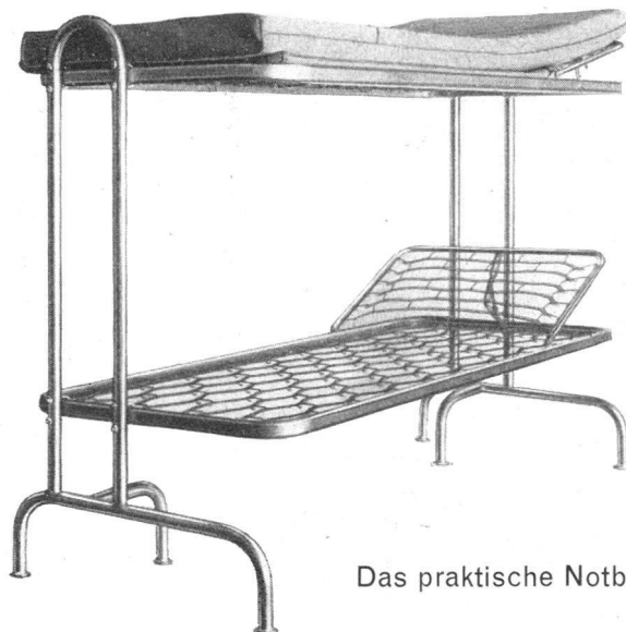
Das praktische Notbett

Wir beraten Sie über: Sanitäts-Mobiliar, Verbandwagen, Instrumente, Operationslampen, Medizinal-Saugpumpen mit Fußbetrieb, Narkose-Apparate, Zentralstationen und fahrbare Einzelgeräte für die Sauerstoff-Therapie, Sterilisatoren (elektrisch und mit Benzinvergaser), Pflege-Utensilien, Laboratoriumsbedarf usw.