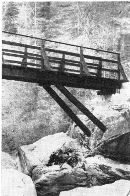
Die fachmännisch ausgeführte Holzkonstruktion zeugt vom Können unserer Luftschutzsoldaten

Es war wirklich eine Luftschutzkompanie, welche die Stege zur Übung ihrer Fertigkeiten erstellte. In starkem Holz, auf Zwischenstützen erstellt, werden sie viele Jahre überdauern und damit vom technischen Können der Erbauer zeugen. Noch erscheinen sie schwarz in ihrem frischen Karbolanstrich, aber die Witterung wird sie bald aufhellen, und dann werden sie sich prächtig in die