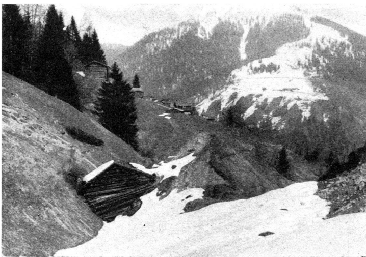
Ein abgerutschter Stall Im Hintergrund das Dorf Schuders

Was der unermüdliche Präsident Erich Hampe , von der deutschen Bundesanstalt für zivilen Luftschutz, in diesem 70seitigen, schmucken Büchlein berichtet, ist vorbildlich sachlich, gemeinverständlich und von