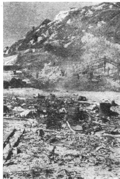
Was von einem Materiallager nach einem kommunistischen Angriff übriggeblieben ist.