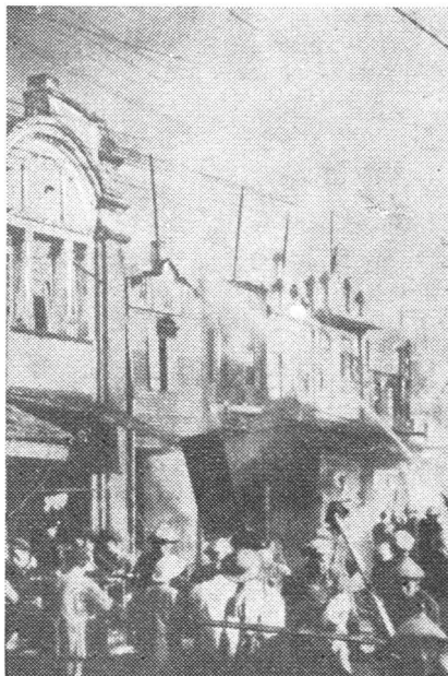
Ein Luftangriff der Nationalchinesen hat in der Hafenstadt Futschau erheblichen Schaden angerichtet.