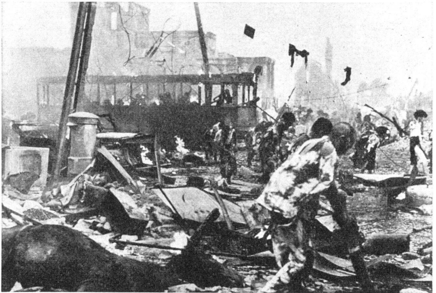
Dann geschah es