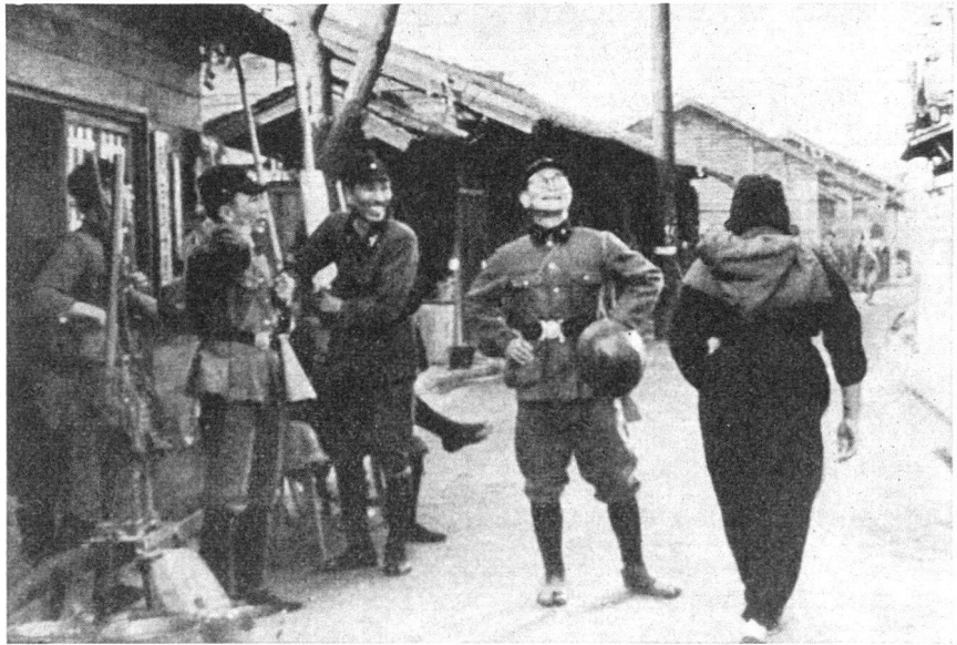
Es gab keinen Fliegeralarm

Inzwischen bleiben zivile Schutzmassnahmen nötig . Jedenfalls hat die westdeutsche Bundesregierung neuerdings die Frage, ob Luftschutz noch einen Sinn habe, aus guten Gründen mit «Ja!» beantwortet und das Luftschutzbudget von 12 auf 82 Millionen DM erhöht. Und der kluge spanische Botschafter Salvador de Madariaga hat die Weltlage wie folgt gekennzeichnet: «Der Krieg im grossen Maßstab ist durch die Wasserstoffbombe aus dem Bereich der Möglichkeiten ausgeschaltet worden. Daher müssen wir alle unsere Ueberlegungen am Kalten Krieg orientieren». Dass die politischen Ursachen gewaltsamer Konflikte unter der augenblicklich etwas geglättet erscheinenden diplomatischen Oberfläche der internationalen Beziehungen fortbestehen und jederzeit wieder in begrenzte Kriege mit herkömmlichen Waffen ausarten können, ist Tatsache. Daran ist zu denken, wenn es um die Beurteilung, Bewilligung und Ausführung neuer Luftschutzmassnahmen geht. Reale Ueberlegungen und entsprechende Vorkehren müssen — leider — schöneren Wünschen und Hoffnungen vorangehen. Ein ausgebautes Warnsystem und der rechtzeitige Bau von Schutzräumen gehören daher zu den wichtigsten Lehren der Katastrophe von Hiroshima.