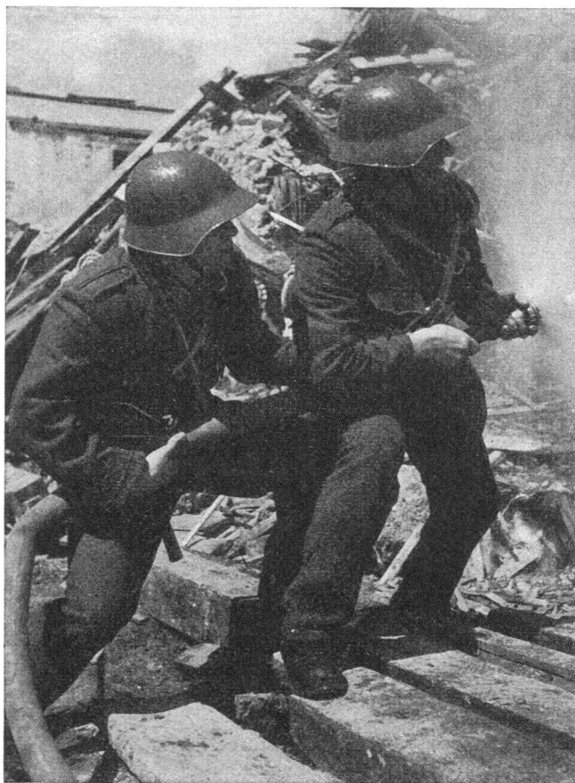
Im Kampf gegen das Feuer

Die Luftschutztruppe ist nun zahlenmässig nicht so stark, dass sie allerorten eingesetzt werden kann. Nach siedlungsmässigen, verkehrs- und wirtschaftspolitischen und militärischen Gesichtspunkten sind ein grosser Teil der Luftschutz-Bataillone oder -Kompagnien den wichtigsten und grössten Städten als örtliche Truppen zugeteilt. Eine mobile Reserve kann da und dort zur Verstärkung der Abwehr eingesetzt werden. Aber viele Ortschaften von 15 000 und weniger Einwohnern haben keine Luftschutztruppe in der Nähe stationiert. Schon darum muss eine zivile Schutzorganisation als Ergänzung zur Truppe geschaffen werden. Aber auch in den grossen Städten wird die zivile Schutzorganisation nötig sein. Sie kann viele Entstehungsbrände und Einzelherde und die nicht zu grossen Brände in den ausgedehnten Aussenquartieren mit eher lockerer Bebauung übernehmen. Die Luftschutztruppe wird dann an den meistgefährdeten Stellen mit geschlossener Ueberbauung eingesetzt (Stadtkern, Industriequar-