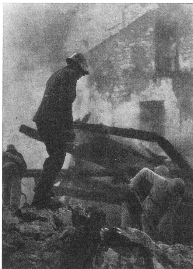
Befreiung von Verschütteten