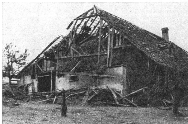
Wirkungen eines Sprengbombeneinschlages bei Riggisberg (Kt. Bern, im Jahre 1943).

Auch kleine Ortschaften in der am Kriege unbeteiligten Schweiz blieben nicht verschont