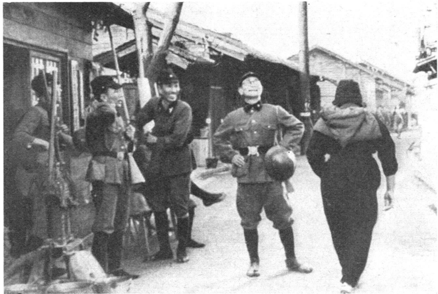
Es gab keinen Fliegeralarm

Inzwischen bleiben zivile Schutzmassnahmen nötig . Jedenfalls hat die westdeutsche Bundesregierung neuerdings die Frage, ob Luftschutz noch einen Sinn habe, aus guten Gründen mit «Ja!» beantwortet und das Luftschutzbudget von 12 auf 82 Millionen DM erhöht. Und der kluge spanische Botschafter Salvador de Madariaga hat die Weltlage wie folgt gekennzeichnet: «Der Krieg im grossen Maßstab ist durch die Wasserstoffbombe aus dem Bereich der Möglichkeiten ausgeschaltet worden. Daher müssen wir alle unsere Ueberlegungen am Kalten Krieg orientieren». Dass die politischen Ursachen gewaltsamer Konflikte unter der augenblicklich etwas geglättet erscheinenden diplomatischen Oberfläche der internationalen Beziehungen fortbestehen und jederzeit wieder in begrenzte Kriege mit herkömmlichen Waffen ausarten können, ist Tatsache. Daran ist zu denken, wenn es um die Beurteilung, Bewilligung und Ausführung neuer Luftschutzmassnahmen geht. Reale Ueberlegungen und entsprechende Vorkehren müssen — leider — schöneren Wünschen und Hoffnungen vorangehen. Ein ausgebautes Warnsystem und der rechtzeitige Bau von Schutzräumen gehören daher zu den wichtigsten Lehren der Katastrophe von Hiroshima.