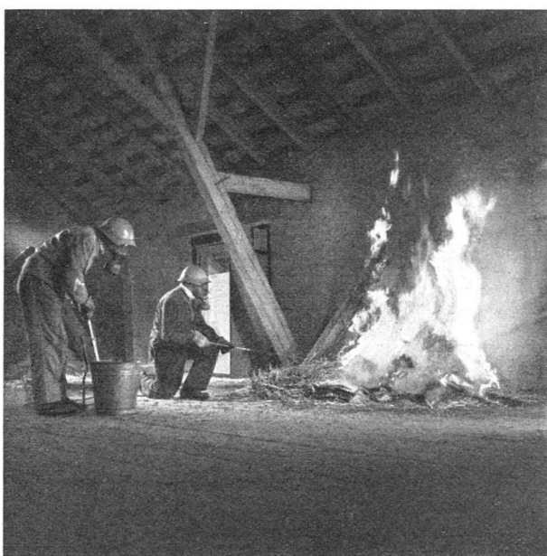
Erfolgreiche Schadenbekämpfung mit Eimerspritze und Feuerhaken