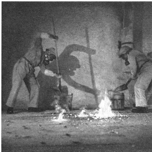
Eine Brandbombe wird mit Sand unschädlich gemacht

Vorweg liegen diese Aufgaben beim Gebäudechef, mit dessen Ausbildung letztes Jahr begonnen wurde.