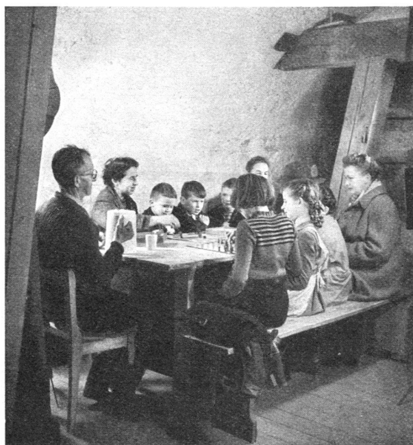
Ablenkende Beschäftigung ist wichtig

Allfällige Regionsinstruktoren sind die Gehilfen der Kantonsinstruktoren. Sie leiten und beaufsichtigen nach Weisung des Kantons die Organisation und Ausbildung der Hauswehren in der betreffenden Region.