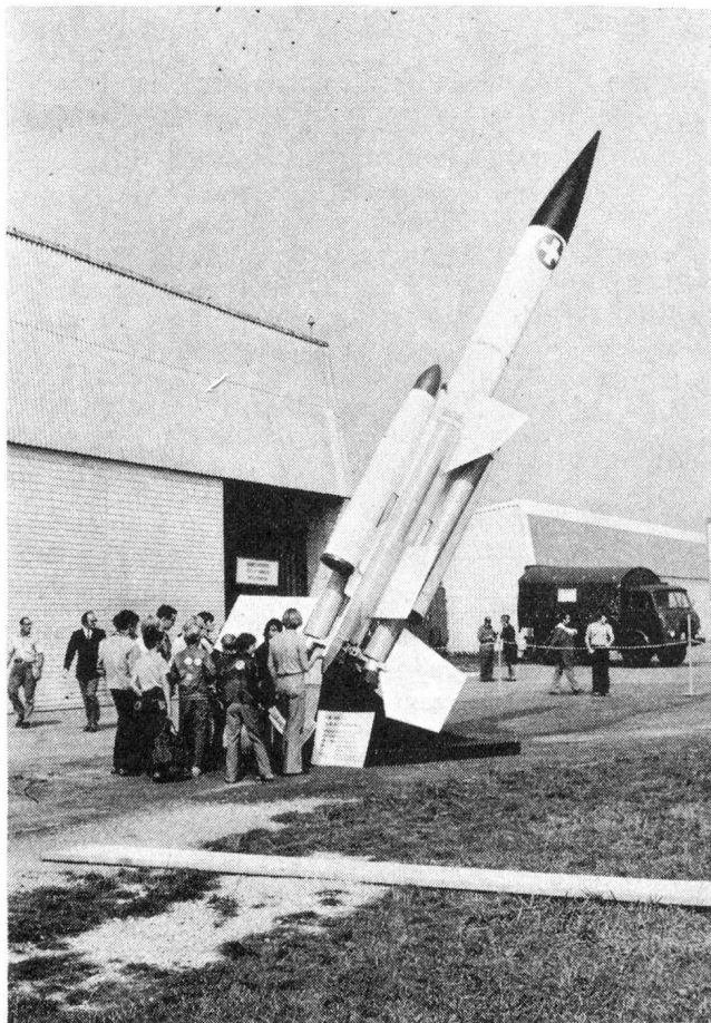
Unübersehbar im weiten Ausstellungsgelände war dieses Muster einer Bloodhound-Mk-2-Fliegerabwehr-Lenk-waffe, wie sie auch von unserer Armee angeschafft wurde

Organisatoren der Jubiläumsveranstaltung haben damit der instruktiven Information über unsere Landesverteidigung einen wertvollen Dienst geleistet. Unsere Bilder geben einen Ueberblick dieser interessanten Ausstellung.