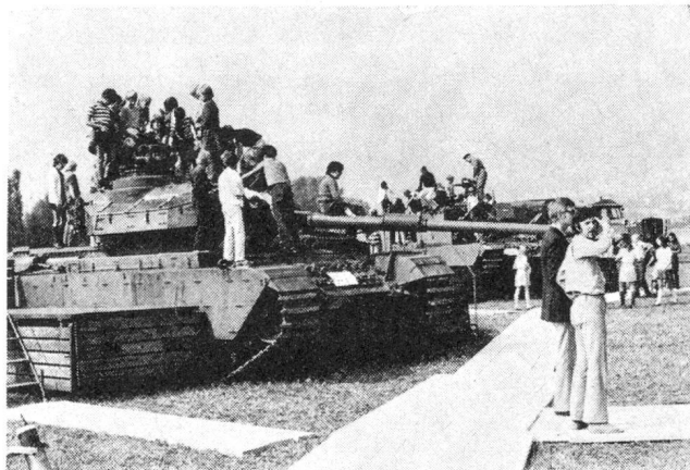
Grosses Interesse fanden vor allem bei der Jugend die Panzer