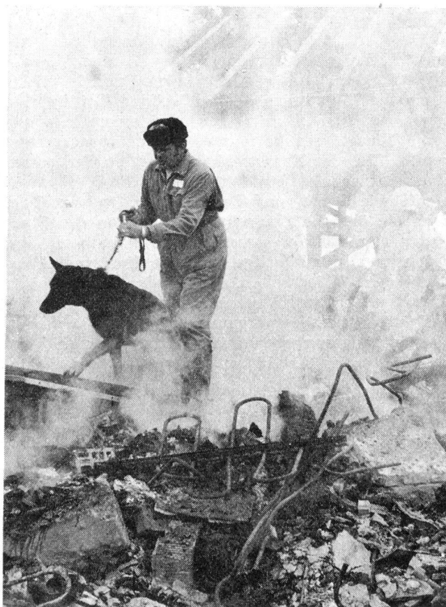
Ein Katastrophenhund im Einsatz