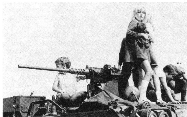
Die Jungen wollen es genau wissen und untersuchten jedes Detail