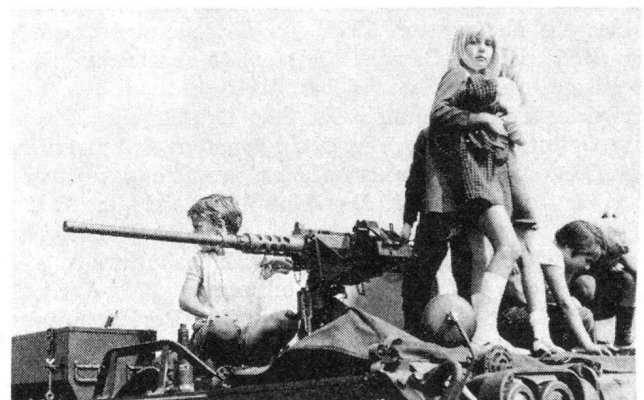
Die Jungen wollen es genau wissen und untersuchten jedes Detail