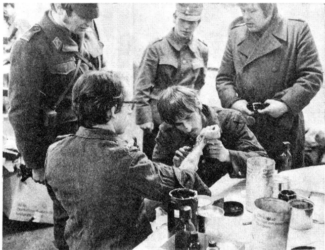
1 Präparierung der Verletztenattrappen, mit denen ein Teil der Figuranten zur Erhöhung der Übungsrealistik versehen wurde

Nicht gut steht es mit der Ausbildung. Von den 78 000 Eingeteilten sind lediglich 13 000 ausgebildet. Auch mit dem Bau der geschützten Anlagen für die örtlichen Organisationen und mit der Bereitstellung des Materials sind wir trotz laufenden Anstrengun-