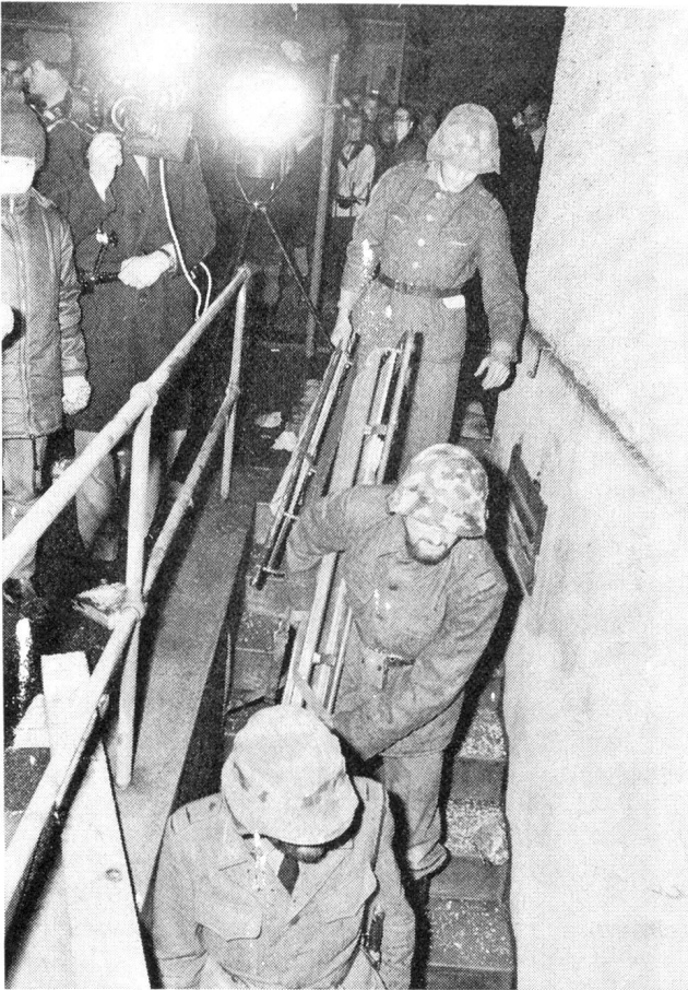
3 Einsatz der Luftschutztruppen zum Abtransport der Verletzten

Luftschutztruppen, seinen Sanitätsformationen und seinem Betreuungsdienst.