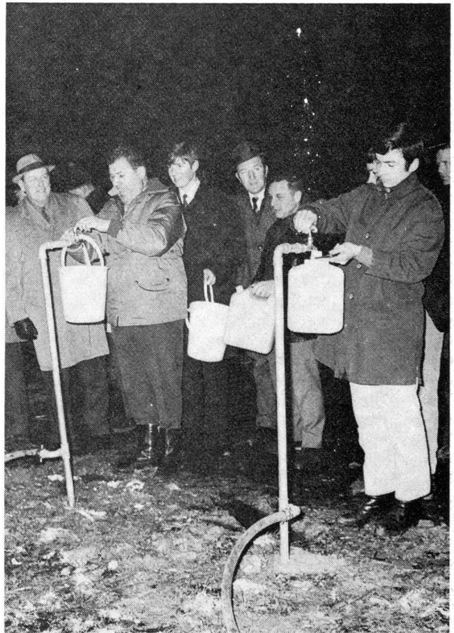
4 In Veltheim fiel das Wasser infolge radioaktiver Verseuchung aus. Ein Spezialteam der Wasserversorgung zapfte eine unversehrte Grundwasserquelle an, auf die in weiser Voraussicht schon Bohrungen bis zum Grundwasserspiegel vorgetrieben worden waren. Nach zwei Stunden konnte die Bevölkerung bereits mit unverseuchtem Wasser versorgt werden