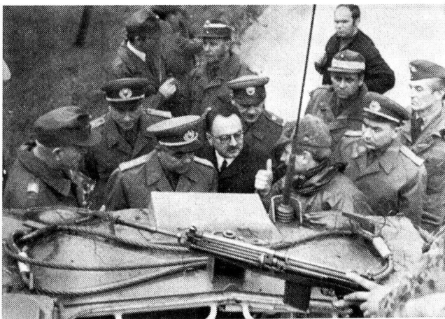
Der rumänische Verteidigungsminister, Generaloberst Ion Ionita, interessierte sich vor allem für Waffen und Ausrüstung, hier für den Saurer-Schützenpanzer, der ihm von einem Panzergrenadier erklärt wird

Die Manöveranlage ging von einer Partei Orange und Blau aus, die in freier Führung gegeneinander operierten. Orange, sehr stark mit Panzerverbänden dotiert, hatte den Auftrag, die blaue Abwehrfront zu durchbrechen, während Blau nach beweglicher Abwehr, später verstärkt durch aus dem Hinterland nachgeführte Panzerverbände, zum Gegenstoss antrat. Es ging dabei nach dem Willen der Uebungsleitung nicht um Sieger und Besiegte, sondern um die Schulung der Führung auf allen Ebenen, die Ueberprüfung der Ausbildung und die Belastbarkeit der Truppe, die Ueberprüfung von Organisation und Ausrüstung, die Sammlung von Erfahrungen hinsichtlich der Zusammenarbeit mit den Landwehrverbänden und der Versorgung der Truppe.