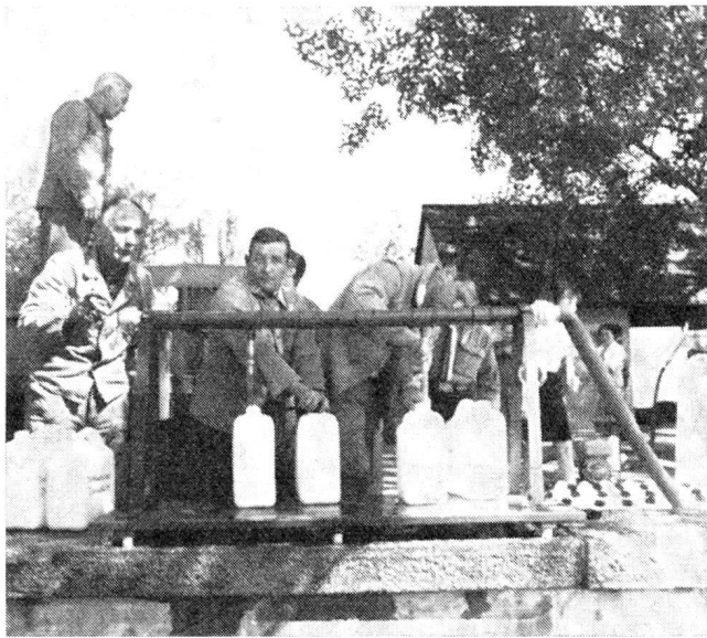
Trinkwasserabfüllanlage. Sie vermag 450 bis 650 10-Liter-Kanister pro Stunde abzufüllen