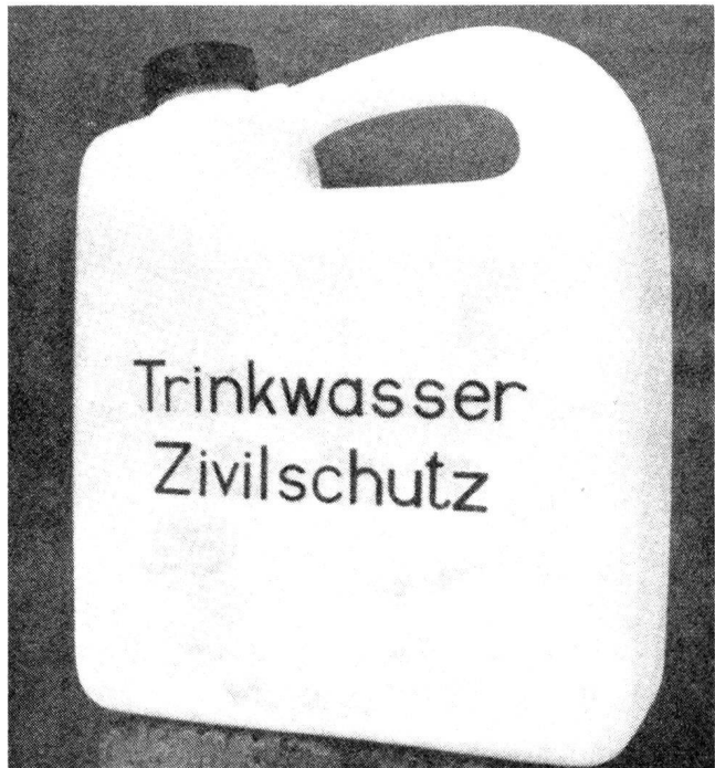
Trinkwassereinheitskanister. Auf Grund dieses Appells wurden über 2000 Einheitskanister gekauft, d. h. pro Haushalt 1 bis 20 Stück

Ausnahmen heute die Regel ist. Um zu einer zeitlich und wirkungsmässig optimalen Lösung zu gelangen, empfiehlt sich — vorerst auf Bundesebene — die Anschaffung einer kleinern Zahl von mobilen, lufttransportierbaren Wasseraufbereitungsgeräten, welche, dezentral eingelagert, durch eine noch zu schaffende Einsatz- und Alarmzentrale des Bundesamtes für Zivilschutz in die Katastrophenzone transportiert werden könnten. Es scheint uns jedoch gegeben, dass die Kantone im Sinne der intra- und interkantonalen Katastrophenhilfe diesem Beispiel folgen sollten. Parallel dazu sind natürlich die Probleme der Wassernotreserven, der Wassertransporte und der Noterschliessung von Grundwasservorkommen ohne Verzug in Angriff zu nehmen.