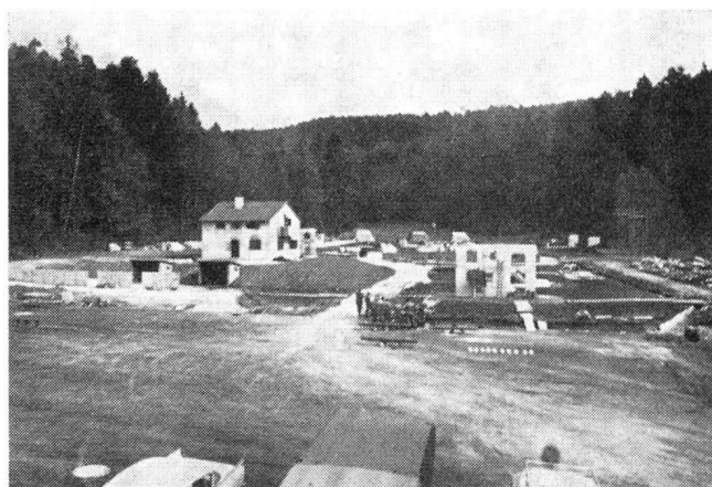
Blick auf das Uebungsgelände im «Orbüel»

Die Kursräumlichkeiten sind im Jahre 1968 während 42 Wochen und das Uebungsgelände während 28 Wochen mit Kursen von Bund, Kanton und Stadt belegt. Nach den bisherigen Feststellungen haben sich die Anlagen gut bewährt.