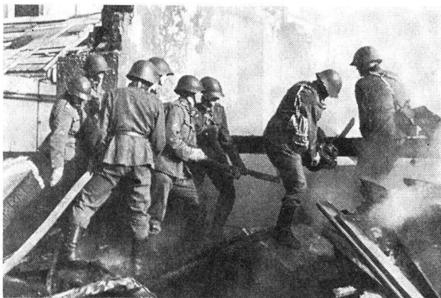
Balken und Holztrümmer, die den Weg versperren, werden mit der Motorsäge bearbeitet und der weitere Vormarsch freigelegt, um dann auch mit anderen Trümmern fertig zu werden.

Zivilschutzes. Er unterstrich, dass man bei der Schaffung der Truppenordnung 1951 mit Recht nicht davor zurückgeschreckt sei, bei der Armee einen Aderlass zugunsten des Schutzes der Zivilbevölkerung vorzunehmen. Ein solcher Aderlass, der damals selbstverständlich hingenommen wurde, ist leider heute wieder umstritten, obwohl er sich im Interesse eines schlagkräftigen Zivilschutzes aufdrängt. Oberst Jeanmaire verwies auch auf das kürzlich erschienene neue Reglement für den Einsatz der Luftschutztruppen, das ihre