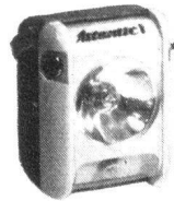
Laterne Atl. F

Verlangen Sie bitte ein ausführliches Angebot oder rufen Sie uns an, wir können Sie fachmännisch beraten