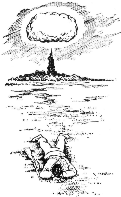
图四 无地形、地物可利用时，应就地背向爆炸中心卧倒，并将手掩盖好