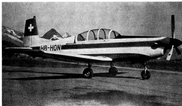
Der modifizierte schweizerische Militärtrainer P-3B

H. H. Die Pilatus-Flugzeugwerke AG in Stans NW haben eine neue Version ihres Schul- und Übungsflugzeuges P-3, das vor Jahren — anfänglich in einer kleineren Vorserie und in der Folge in einer Grossserie — an die schweizerische Flugwaffe geliefert wurde, entwickelt. Die heute noch überaus bewährten Trainingsflugzeuge P-3 besitzen den Sechszylinder-Boxermotor Lycoming GO-435, der eine maximale Leistung von 265 PS erreicht.