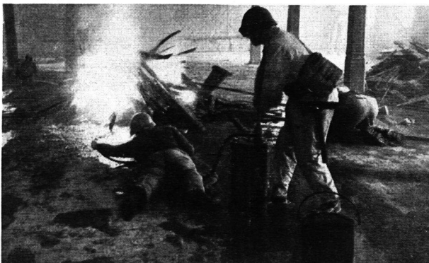
Abb. 2. Zens.-Nr. IV T. 785

Die zwei ersten Tage wurden durch Uebungen im Kreislaufgerät und in der Bekämpfung von Zimmerbränden ausgefüllt. Jeder Teilnehmer konnte am eigenen Leib die Zweckmässigkeit all der so oft gehörten und in der Theorie weitergegebenen Löschregeln erfahren: Angriff von unten nach oben; kriechend vorrücken (Abb. 2); Wasserstrahl möglichst nahe in die brennende Materie, nicht einfach ins Feuer richten; für Rauchabzug sorgen; Deckung beziehen (Abb. 3) etc.