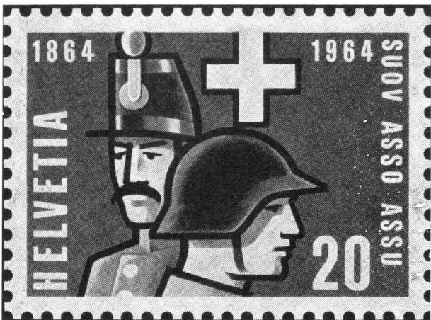
Bilder des Talers und der Sondermarke PTT

th. Es ist hundert Jahre her, seit 1864 in Freiburg der Schweizerische Unteroffiziersverband gegründet wurde, der heute in allen Landesteilen mit 150 Sektionen über 20 000 Mitglieder umfasst, um heute noch wie damals für die freiwillige ausserdienstliche Ertüchtigung unserer Kader einzutreten. Der SUOV begeht dieses Jubiläumsjahr nicht mit lauten Feiern, sondern durch eine Reihe von Veranstaltungen und Kundgebungen, die der weiteren Förderung der ausserdienstlichen Tätigkeit dienen und unterstreichen sollen, dass tüchtige Kader in der Armee ebenso wie im Berufsleben auch im Atomzeitalter nach wie vor mitbestimmend sind, wenn es um Erfolg oder Misserfolg geht.