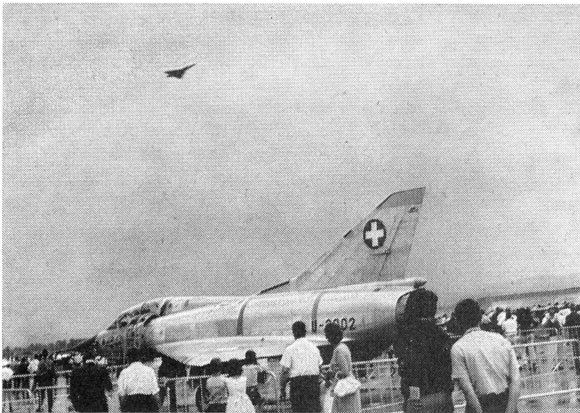
Grosses Interesse fand natürlich der auf dem Flugplatz aufgestellte «Mirage III», während gerade das in der Schweiz befindliche zweite Exemplar mit einer Geschwindigkeit von 1200 km/h über den Flugplatz braust.

die kostspieligen Anstrengungen für die Sicherung der Luftverteidigung.