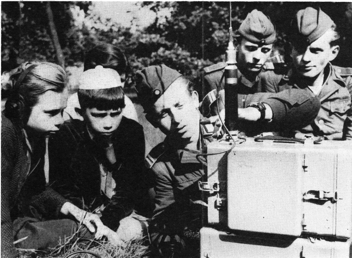
Von einem Kinderfest der «Nationalen Volksarmee» im Pinierpark Ernst-Thälmann in Ostberlin, an dem Nachrichtensoldaten die Funkgeräte erklären

ZEITSCHRIFT FÜR TOTALE ABWEHRBEREITSCHAFT REVUE POUR LES PROBLEMES RELATIFS A LA DEFENSE TOTALE RIVISTA PER LA PROTEZIONE TOTALE