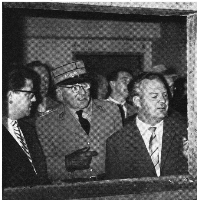
Demonstration vor einer Delegation deutscher Parlamentarier