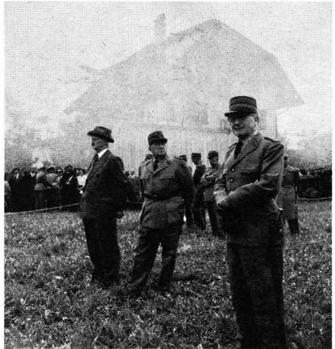
Der Vorsteher des Eidg. Militärdepartements (links), der Ausbildungschef der Armee (Mitte) und der Chef der Abteilung für Luftschutz (rechts)

Eine Unterhaltung mit ihm ist mir besonders im Gedächtnis haften geblieben, weil sie mir damals grossen Eindruck machte. Oberst Münch erzählte: «Ich ging mit Hptm. X skifahren. Oben am Hang visiert