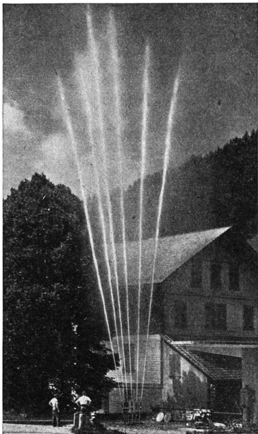
VOGT-MOTORSPRITZEN und Armaturen in jeder Ausführung GEBRÜDER VOGT, Maschinenfabrik, Oberdiessbach-BE Gegründet 1916