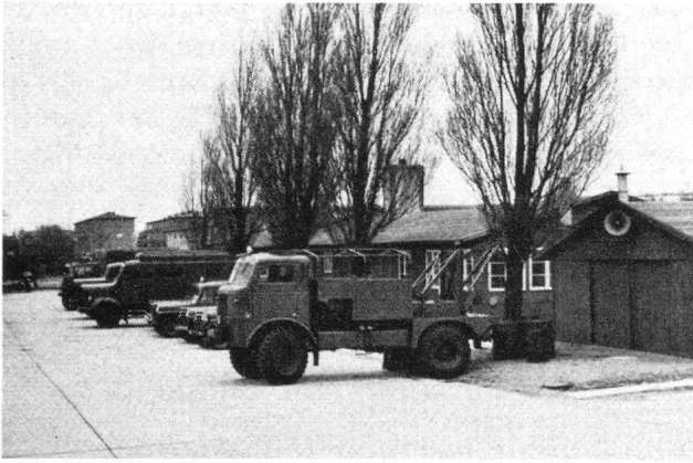
Motor- und Spezialfahrzeuge des dänischen Zivilverteidigungskorps in einer der zahlreichen Mobilmachungsstationen des Landes.