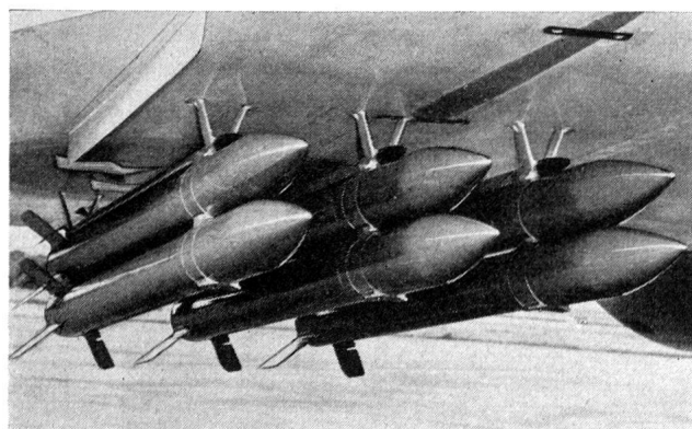
Der DRAKEN mit 12 Bofors-Raketen des Kalibers 13,5 cm bewaffnet. Unter jedem Flügel sind je sechs solcher «Air-to-ground»-Raketengeschosse, d. h. Luft/Boden-Angriffsraketen angebracht. Mit andern Worten: Der DRAKEN mit Erdkampfbewaffnung.

Werkbesuch bot sich Gelegenheit, die modernen Anlagen der schwedischen SAAB-Werke eingehend zu besichtigen, wobei auch ein Augenschein der vorbildlich eingerichteten Untergrund-Fabrikationsanlagen miteinbezogen war. Dieser Werkbesuch, die neuzeitlichen Fertigungsmethoden sowie zwei Flugdemonstrationen des neuesten SAAB-Baumusters J-35 «Draken» hinterliessen denn auch einen vorzüglichen Eindruck.