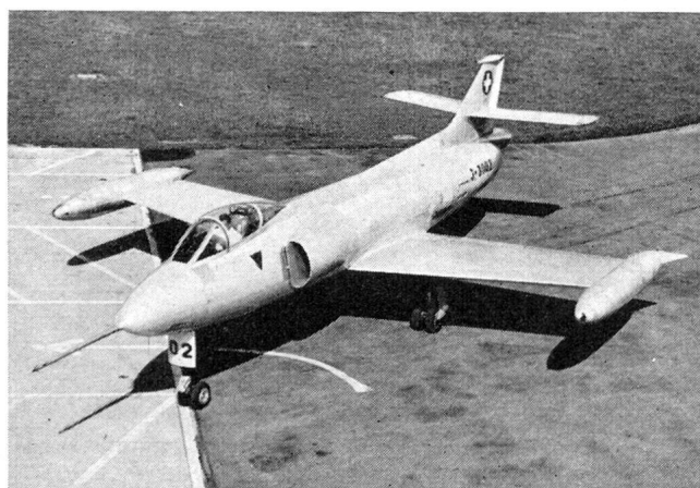
Erdkampfflugzeug P 16 der FFA Altenrhein (zweiter Prototyp)

Das Hunter-Flugzeug in seine Bauteile zerlegt Diese Zeichnung zeigt den überaus praktischen Aufbau bzw. Zusammenbau dieses Flugzeuges aus montagefertigen Elementen, was leichte Austauschbarkeit gewährleistet; ein für den militärischen Einsatz überaus wichtiger Faktor.