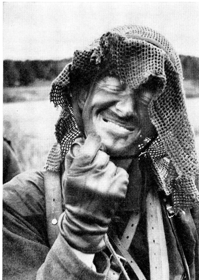
Schwedischer Soldat im Manöverdienst. Zur Ausrüstung gehört ein feldgrauer Schminktift, der nicht nur die hellen Gesichter tarnt, sondern auch einen gewissen Schutz der Haut vor den Einwirkungen der Wärmestrahlen bietet.

Bomben- oder Sabotageschäden, ihrer Meldung und dem Eingreifen zu ihrer Bekämpfung immer noch zu viel Zeit verstreicht. Die Uebung hat klar ergeben, dass dem Beobachtungs-, Melde- und Uebermittlungsdienst auch in der Zivilverteidigung grosse Bedeutung zukommt, dass hier eine bessere Koordinierung und ein vermehrter Einsatz von Funkmitteln angestrebt