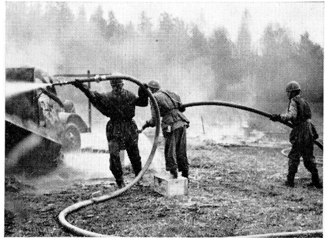
Spezialeinheiten der schwedischen Armee bei der Bekämpfung eines Brandes, der in einem Truppenlager durch den Abwurf von Napalmbomben verursacht wurde. Bild von einer Demonstration anlässlich der schwedischen Atommanöver in Dalarna.

Ganz allgemein möchte ich vorerst zusammenfassen, dass die gründliche Vorbereitung dieser Zivilverteidigungsübung und ihre realistische Durchführung einen imponierenden Gesamteindruck hinterliess. Der Berichtersteller möchte wünschen, dass ähnliche Uebungen, an denen in kriegsmässiger Zusammenarbeit die zivilen und militärischen Behörden beteiligt sind und an denen an den notwendigen Markierungsmitteln nicht gespart wird, auch bei uns durchgeführt