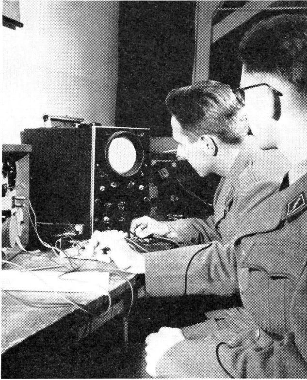
Rekruten der ersten schweizerischen Radar-RS am Anzeigergerät

Im obern Teil des komplizierten Gerätes sehen wir den Radar-Schirm. Je rascher die Meldung eines fremden Flugzeuges im Ernstfall von diesem Radar-Schirm zum Tisch des Kommandanten gelangt, um so rascher können die erforderlichen Abwehrmassnahmen getroffen werden.