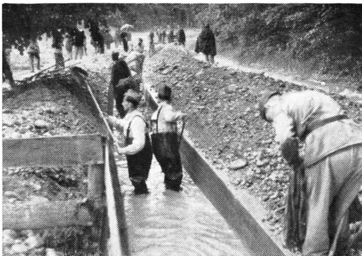
Soldaten machen das Bachbett frei.