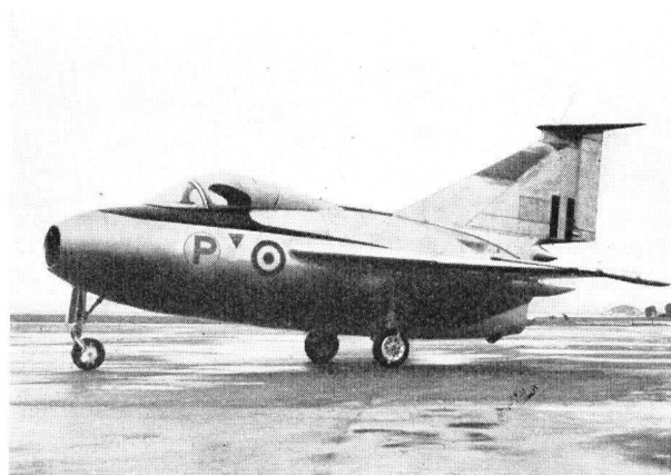
Das Baumuster DELTA F. D.-1

Neueste Forschungsflugzeuge in dieser Richtung sind die nachfolgend genannten Prototypen: