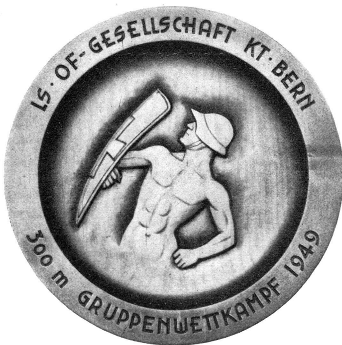
Wandteller für den ausserkantonalen Gruppenwettkampf \frac{1}{3} natürliche Grösse von P. Flück, Holzbildhauer, Brienz